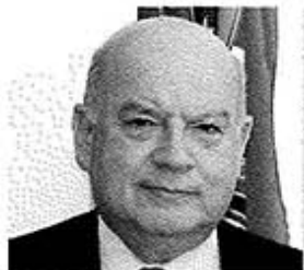
José Miguel Insulza